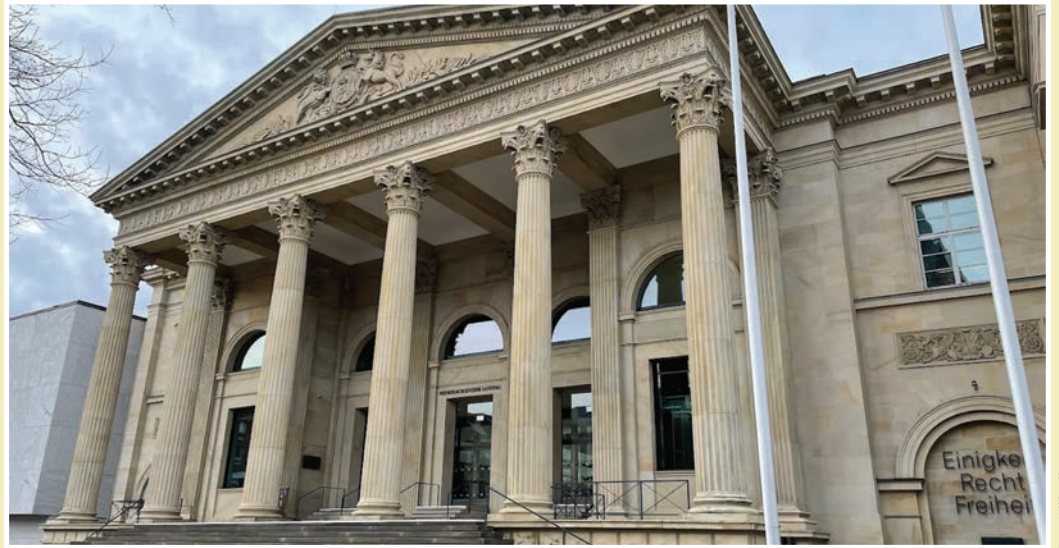
De operaal van Ernst August in het Leineschloss is tegenwoordig de vergaderzaal van de landsdag van Nedersaksen. Hannover, dat totaal plat was gebombardeerd, werd een voorbeeld van moderne stadsontwikkeling. Het Leibnizhuis en het Leineschloss zijn gerestaureerd maar de oorspronkelijke binnenstad is verdwenen.

Begin april, bijna een half jaar later dan gepland, arriveert Leibniz in München om de Annales Ducum Boiariae te lezen. Een kroniek van de Beierse geschiedschrijver Aventinus, waarin alle Duitse geslachten waren gecategoriseerd. Dit was het voornaamste doel van de reis, want vanwege deze tekst waren de Welfen adellijk laag ingedeeld. Aventinus blijkt zijn geschiedschrijving van het huis Welf te hebben gekopieerd van de Historia de Guelfis principibus , die is te vinden in een klooster in Augsburg. Een dagreis van München. Daar leest Leibniz dat de Welfen afstammen van de marktgraven van Este, hoge adel, en niet de markiezen van Asti, lage adel. Aventinus had zich verschreven. Missie geslaagd zou je zeggen, maar Leibniz heeft de smaak van het reizen te pakken gekregen en wil nu eerst naar het Este-archief in Modena om alles goed uit te pluizen. Misschien komt dat ook omdat Ernst August, een verzotte operafanaat, zijn afwezigheid had gebruikt om de bibliotheek te laten verbouwen tot een operaal.